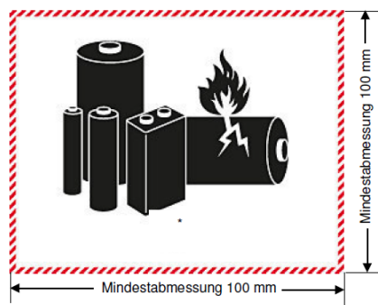
Kennzeichen für Lithiumbatterien